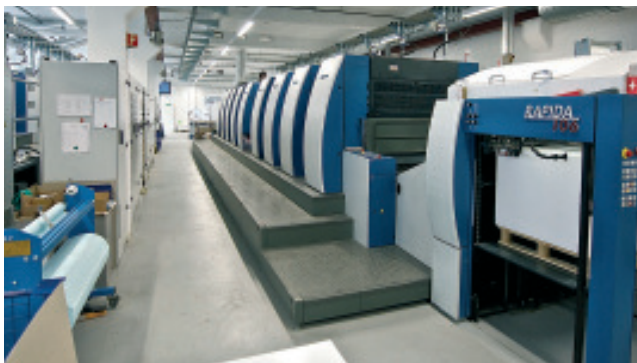
Zwei KBA Rapida 106 in Sechsfarben- und Achtfarbenausführung plus Lack bilden das Herzstück der Druckerei. Die offene Systemarchitektur des Leitstands