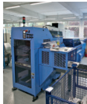
ermöglicht die Anbindung an die Management-Informationssysteme der Kooperationspartner. Ebenfalls vernetzt: der Sammelhefter Primera E140.