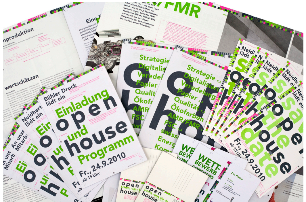
Konzept und Produktion: Neidhart + Schön Group, www.nsgroup.ch ; Gestaltung: Eclat, www.eclat.ch